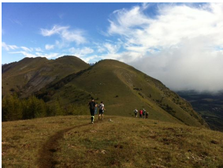
Et 2 ! Et 3 juste derrière...

Allez, il faut enchaîner ces 2 nouvelles bosses, descentes et raidillons qui vont avec ! La dernière est la plus dure...physiquement j'entends, bien raide.