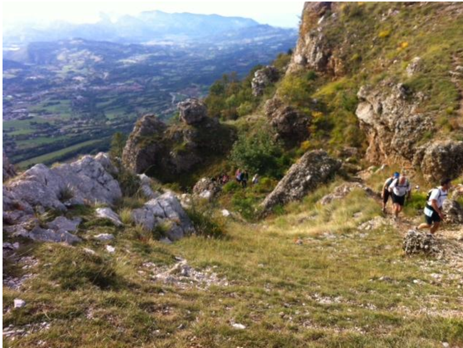
Fin de la grosse montée, reste 3 'petits' cols...