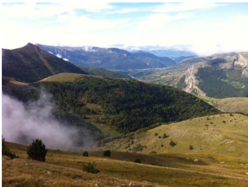
Vue entre 2 bosses 😊